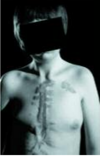
Şekil 2 Birden çok kez yapılan kardiyak işlemlere bağlı ve psikososyal sorun yaratabilen çirkin skarlar. Bakınız Bölüm 6-Psikososyal konular.

Kabul edilebilir pulmoner hipertansiyonun derecesi, eşzamanlı atriyal antiarritmi cerrahisinin kullanılmasına duyulan gereksinim ve kapatma işleminin yapıldığı yaşa bağlı olan semptomatik yanıt olasılığı henüz çözümlenmemiş konulardır. Patent foramen ovalenin kapatılması, hastalığın erken ortaya çıktığı, kriptojenik, geçici iskemik atağı (GIA) olan veya serebrovasküler olay (SVO) geçirmiş olan hastalarda son derece düşük morbidite ile gerçekleştirilebilirse de, bu konuda yeterince kanıt bulunmamaktadır. 41 Son yıllarda yapılan çalışmalar, patent foramen ovale bulunan hastalarda SVO riskinin düzeyini belirlemede aspirinin önem taşıdığını ortaya koymuştur. 42 Tedavi bireye göre ayarlanmalı ve uzman bir nörologun da dahil olduğu multidisipliner bir ekibin kararı olmalıdır.