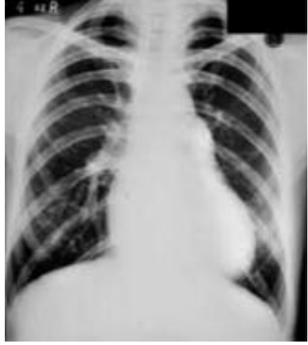
Şekil 3 Eisenmenger sendromu bulunan bir hastanın akciğer grafisi Bakınız bölüm 4.4-Pulmoner Damar Hastalığı

Bu sözü edilen 'ASD' cihazlarının birçoğu, kalbin içindeki ve dışındaki istenmeyen bağlantıların kapatılması amacıyla kullanılabilir. Konjenital ventriküler septal defektin transkateter kapatılması nadiren endike olmakla birlikte, bazı iskemik VSD'ler, kapatmaya uygun olabilir. Baffle kaçakları, sistemik arteriyel, koroner ve venöz fistülümsü bağlantıların tümü, bu gereçler kullanılarak kapatılabilmektedir.