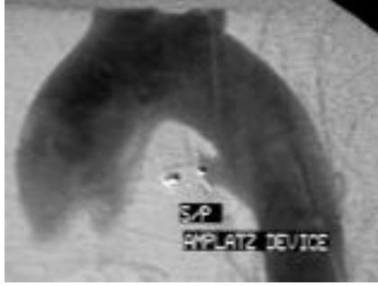
Şekil 4 Amplatzer cihazı kullanılarak, patent duktus arteriyozusun transkateter yolla kapatılması. Bakınız Bölüm 4.7-Girişimsel Kateterizasyon

Mekanik kapağı olan hastaların yönetimi, özellikle de mitral eğimli disk protezleri olan hastalarda güçtür. 49,50 Heparin tedavisi, deri altına veya damar içine verildiğinde, tromboembolik komplikasyonlara yol açabilir. Düşük moleküler ağırlıklı heparinin rolü bilinmemektedir. Warfarin tedavisi anne için daha güvenli olabilirse de, fetal embriyopatiye neden olabilir. Warfarin dozunun <5 mg/gün olması halinde bu riskin az olduğu düşünülmektedir. 51 Siyanotik kalp hastalığı, fetus için de bir risk oluşturur ve bu risk, annedeki hipoksi ile doğru orantılıdır. Annede siyanoz bulunması halinde, gebelik yaşına göre düşük doğum kilosu ve prematürite siktir ve arteriyel oksijen satürasyonu \leq %85 olan annelerde, gebeliklerin sadece %12'si başarılıdır. 52 Gebe kalmama konusunda uyarılması gereken hastalar şunlardır: